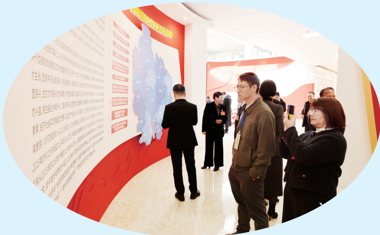
▲领导嘉宾参观成就展。