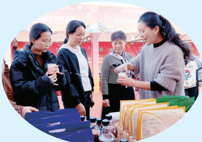
▲供销大集都安专场。