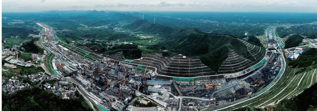
▲在灵山县境内拍摄的平陆运河马道枢纽工程建设现场。

6月21日，灵山县境内的平陆运河马道枢纽工程建设现场一派繁忙景象，工程机械轰鸣，工人们紧张作业，加快推进项目建设。