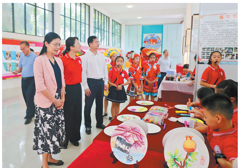
▲参加活动的领导和嘉宾观看孩子们的才艺展示。

民族团结教育、民族文化遗产要从娃娃抓起。本次活动增强了孩子们的民族团结意识,推进了优秀传统文化的传承,充分展现了南宁市民族团结进步创建进校园活动成果和壮乡民族文化魅力,营造了良好的校园环境和民族团结氛围。