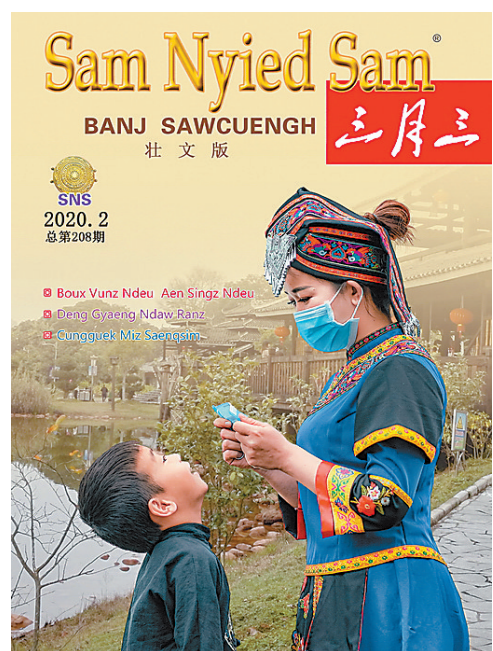
▲《三月三》杂志抗疫专刊封面。

新冠肺炎疫情发生以来,广西三月三杂志社把充分做好疫情防控中的舆论宣传引导作为重大政治任务和最最重要的工作来抓,为此,杂志社精心组织策划,在《三月三》杂志壮文版2020年第2期推出“抗击疫情主题专刊”,专刊收录了以抗疫为主题的小说、散文、诗歌(山歌)和纪实文学等16篇壮文作品,集中反映广西各族同胞齐心抗疫的精神风貌,表达壮乡人民对奋战在抗疫一线的工作者和干部群众的敬意,讴歌大爱,鼓舞士气,为壮乡人民抗疫工作提供精神支撑,有效发挥了强信心、暖人心、聚民心的积极作用。