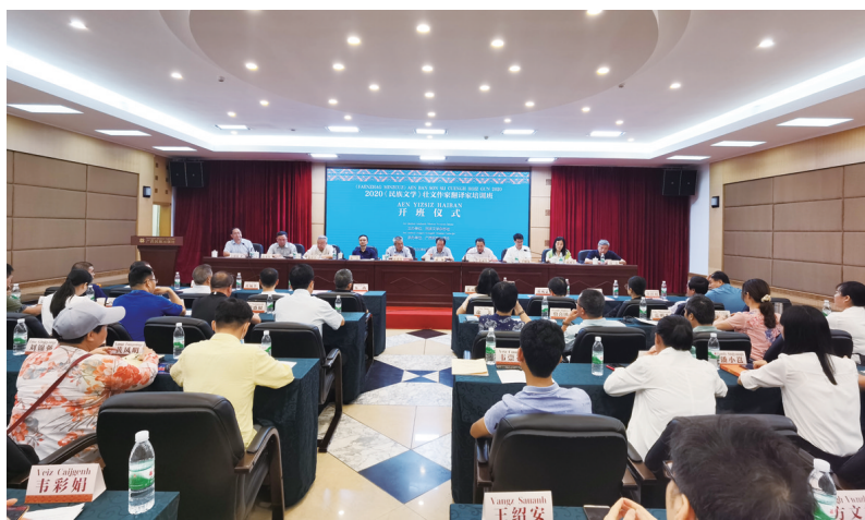
▲培训班开班仪式现场。

8月26日,由民族文学杂志社主办、广西民族出版社承办的“2020年《民族文学》壮文作家翻译家培训班”在南宁顺利开班。中国作协副主席陈建功出席开班仪式并讲话。广西区委原副书记、广西桂学研究会会长潘琦,国家民族政策法规司原司长毛公宁,《民族文学》主编石一宁,广西文联党组成员、副主席石才夫,广西民宗委党组成员、副主任覃永红,中国民族语文翻译局纪委书记李旭练,中国作协主席团委员、广西作协名誉主席冯艺等领导和嘉宾,以及40余位从事壮文创作、翻译的专家学者参加了此次开班仪式。广西民族出版社社长石朝雄主持开班仪式。