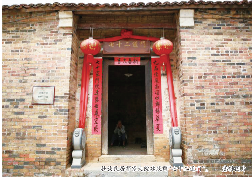
壮族民居邓家大院建筑群“七十二道门”。 资料图片

院子里置放着一些旧木桌、木椅及农具,而壮家人逢年过节必用的木杵与石臼则牵住了我的目光。石臼是壮家人制作各种糯米美食的工具,我信手拿起木杵在石臼用力地舂了几下,沉重的木杵撞击在厚实的石臼里,发出沉闷的回音。听着回音,我仿佛看见了壮家妇孺们舂糯米做糍粑的热闹场面——染了植物颜色的糯米,在木杵的敲打下慢慢变得粘糯,植物与糯米混合的清香淡淡地在农家的院子里散发开来。那时的光阴如此简单快乐、缓慢悠长,那时“七