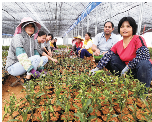
▲附近村民在家门前的浩坤农业基地就业。