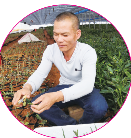
▲工人正在对红宝石青柚枝条进行剪枝培育。