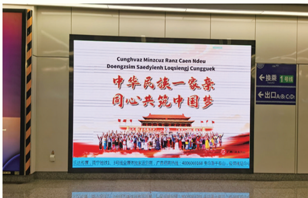
▲LED屏播放宣传民族团结的宣传标语。