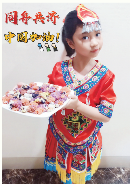
▲学生在“云上三月三·抗疫赞英雄”居家民俗文化活动中展示亲手制作的民族传统美食五色糯米饭。