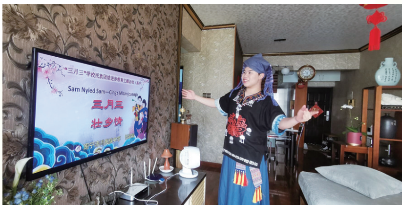
▲该校学生在家中观看空中课堂。

今年“壮族三月三”期间，南宁沛鸿民族中学充分调动了全校师生的积极性，以网络为平台，举办了一次不一样的“壮族三月三”民族团结进步宣传月系列活动。一是开展“壮族三月三·云享壮乡情”主题活动。该校既选派老师参与录制高中阶段“三月三学校民族团结进步教育主题活动线上课程”，认真组织各个年级的学生通过空中课堂收看该课程。二是开展“壮族三月三，通晓民族史”民族知识竞赛。该校通过精心组织题目，设置网上擂台，积极组织学生参与竞赛活动；同时还安排主持人对民