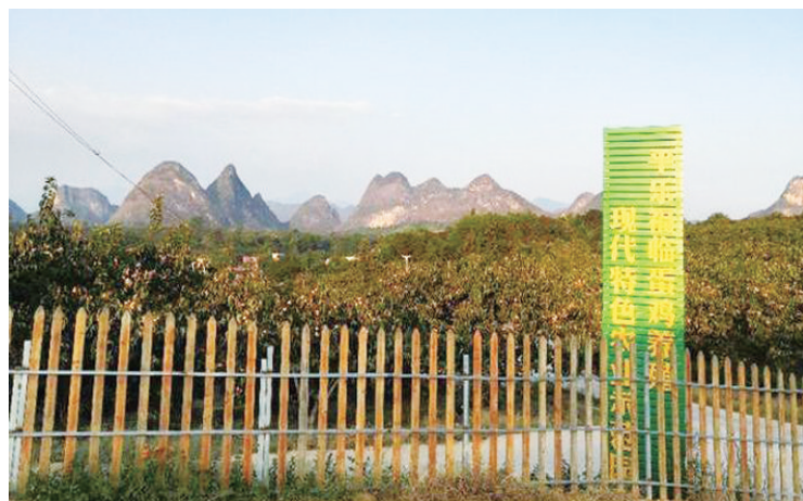
►掩映在绿色中的福临养殖基地。