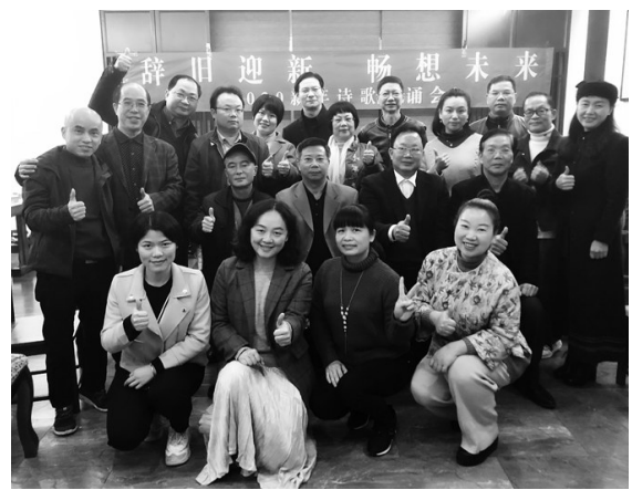
▲“辞旧迎新畅想未来”2020新年诗歌朗诵会现场。