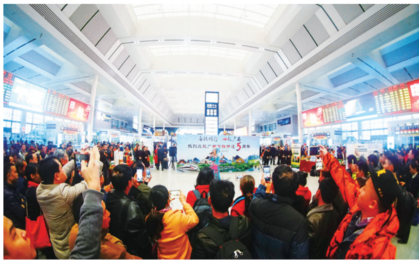
▲凌云唢呐、山歌响彻南宁东站，围观的旅客把舞台包围得水泄不通。