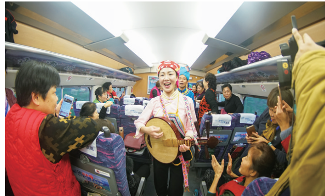
►凌云县少数民族姑娘们在车厢里从一首《凌云茶歌》开始推介凌云旅游资源和凌云特产。