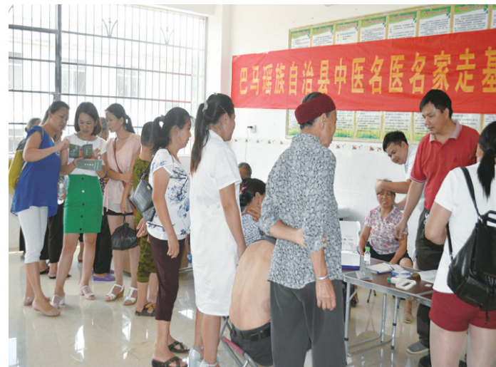
▲巴马民族医院开展中医名医名家走基层活动。

众所周知,“冬病夏治”是传统中医药疗法中的特色疗法。“推广中医‘治未病’理念以及推广视频网络平台建设,在很多疾病的预防中发挥优势,让患者身上的老毛病不再‘犯病’,减少患者疾病发病率。比如‘三伏贴’的治疗方法简便、安全、有效、无毒副作用,在天气炎热,人体阳气旺盛的时候,进行穴位敷贴,可以治疗一些寒冷时节容易复发的病症,从而达到增强机体功能、有效预防冬季易发疾病的目的。通过贴敷中药敷贴去刺激穴位,具有疏通经络,调节脏腑功能