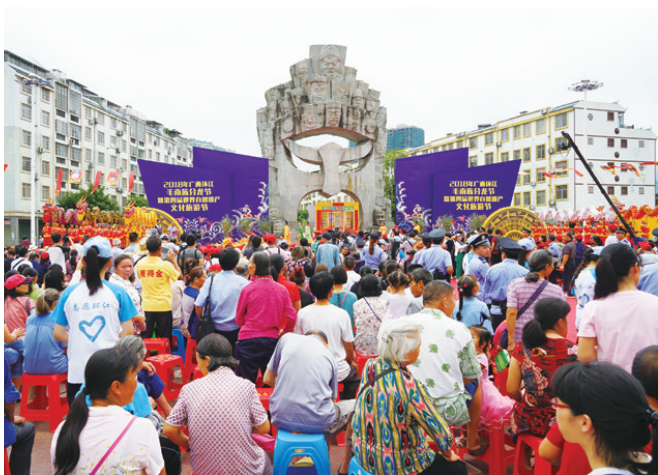
▲分龙节开幕式现场。

环江是全国唯一的毛南族自治县,也是毛南族的发祥地,全县总人口38万人,其中毛南族人口6万人,是全国22个人口在10万人以下的较少民族之一,也是全国唯一能全面展示毛南族及其文化的地方。毛南族分龙节自2009年举办以来,已成功举办了9次,被评为中国最具特色的民族节庆,是广西十大节庆品牌之一。