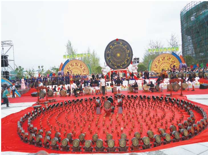
▲世界铜鼓王认证和授匾仪式。