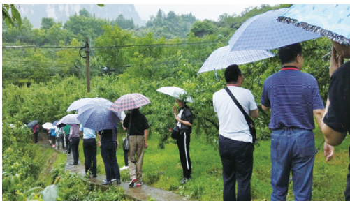
▲社长总编“乡村振兴看黔江”参访活动。

中国少数民族地区报新闻奖是全国少数民族地区报纸综合性年度新闻优秀作品的最高奖项。本届新闻奖共有全国60多家民族兄弟报979件少数民族新闻作品参与角逐,评选出报纸消息、通讯、版面、标题、散文、新媒体、评论、报告文学、系列报道、摄影10大类奖项。评选结束后,与会嘉宾还深入黔江区冯家街道、石市镇、小南海镇、濯水镇、中塘乡、水市乡等地开展社长总编“乡村振兴看黔江”参访活动,全面宣传推广黔江。