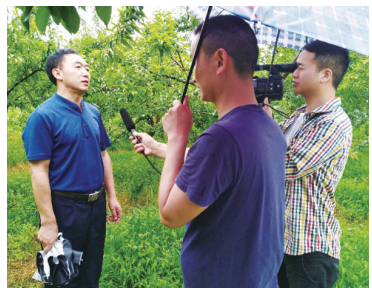
▲社长总编“乡村振兴看黔江”参访活动中参访者接受当地记者采访。