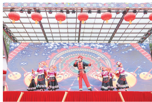
▲精彩的唱山歌表演。