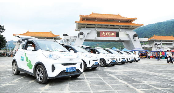
▲共享汽车到场助阵。