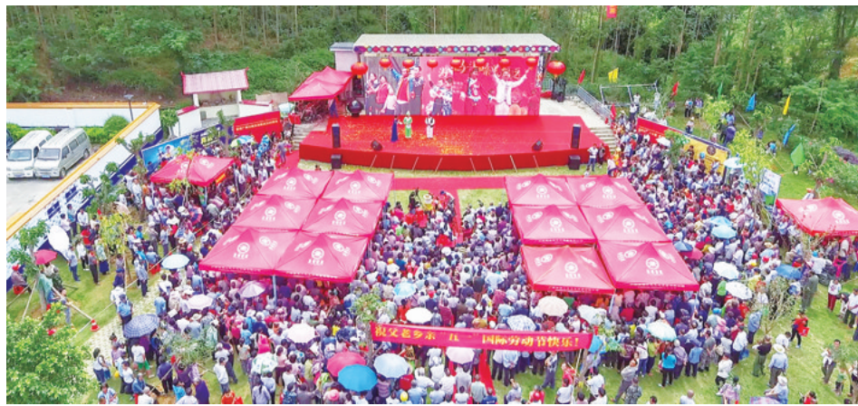
▲歌圩现场人山人海。

据了解,大明山歌圩继承了大明山南麓千年廖江古歌圩每月对歌的传统,自2016年恢复举办以来,每月1日风雨无阻,经过不断摸索与创新,逐步形成广西唯一固定日期、持续每月举办的大型民俗文化活动和环大明山最大的固定圩日。歌圩立足于环大明山厚重的历史文化底