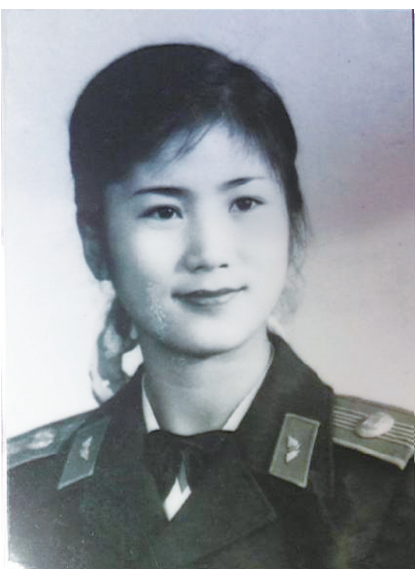
▲时在空军政工部副部长的岑云端照片。