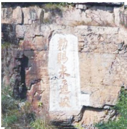
▲桂平市“動賜永通峽”石刻。