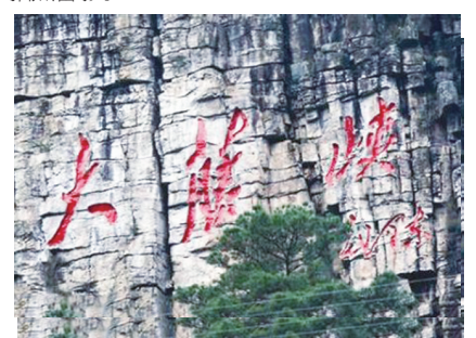
▲桂平“大藤峡”崖刻。 ▲桂平“大藤峡”崖刻。

贵港及桂平市非常重视毛主席题写“大藤峡”这件事情。近年,桂平市以此为由,将毛主席手书“大藤峡”三字刻在大藤峡桂平地段的北岸崖壁上。从此,美丽而神奇的大藤峡又增添了一处独特景观,往来的游人多于此进行拍照留影。