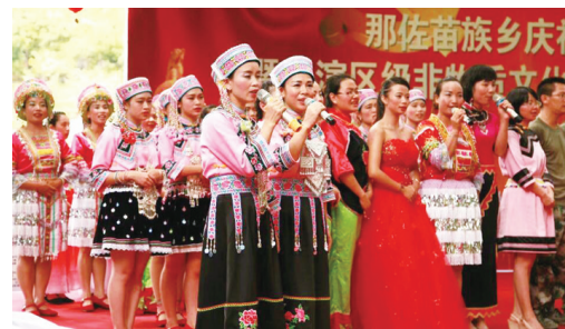
▲山歌唱响民族大团结