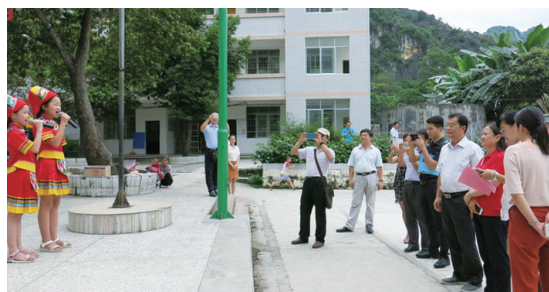
▲遴选考察组观看武篆镇江平小学壮语山歌进课堂展示。