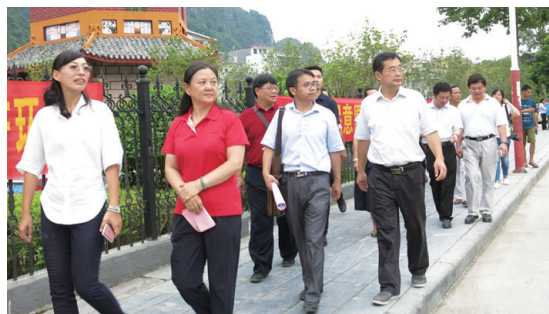
▲遴选考察组考察武篆镇区壮汉双种文字使用情况。

为贯彻落实中央民族工作会议精神和国家民委、教育部2017年度工作安排,推进第二批全国双语和谐乡村(社区)示范单位建设工作,7月5日至7日,以国家民委教育司副司长周晓梅为组长的国家民委、教育部遴选考察组一行5人,前来我区河池市东兰县开展第二批全国双语和谐乡村(社区)示范单位建设单位遴选考察工作。