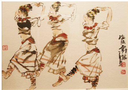
▲郑军里作品《瑶族舞蹈》。