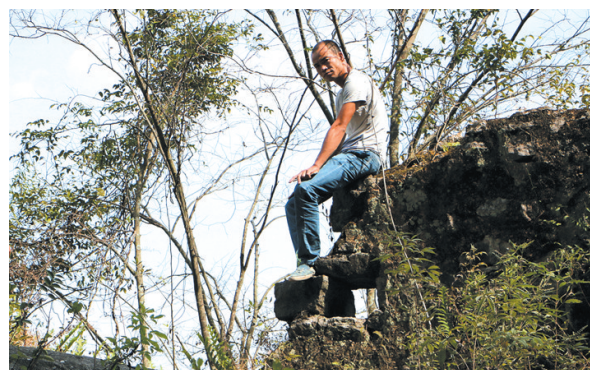
▲被日本鬼子炸开的寨墙。