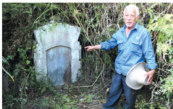
▲古墓陈述一次壮烈的搏杀。