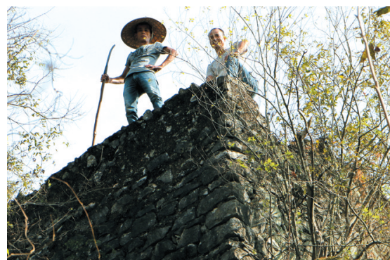
▲保存一百多年的坚固工事。