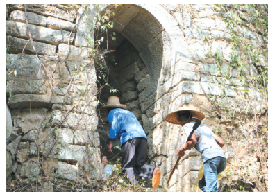
▲屹立在岁月中的寨门。