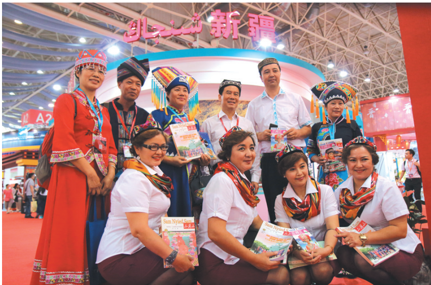
▲与来自新疆的期刊同仁们合影并交换样刊。