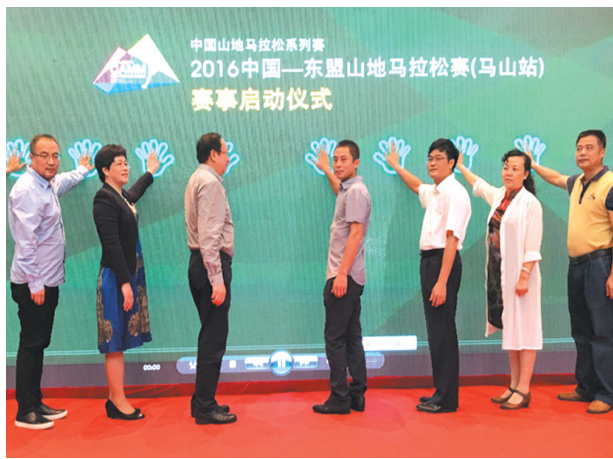
▲2016中国——东盟山地马拉松赛(马山站)赛事启动仪式。

为办好本次赛事和节会,马山县成立了强有力的组织机构,制定了具体的工作实施方案及预案。目前,赛事服务保障各项工作正有条不紊地进行。食品安全、医疗卫生、安全保卫、交通通讯、环境保洁、后勤接待等各项保障工作已全部部署到位。此外,为确保本次活动顺利举办,马山县还组织招募了800多名志愿者参与赛事和节会各项服务活动,为参赛选手、广大群众和游客提供优质的服务。(通讯员 王杰清)