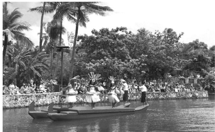
▲不同支系的村民在独木舟上展示各自的土风舞蹈。

我从深山里走来,带着石磨磨砺的岁月,使我没有被忙碌的日子转晕了方向,没有被被红酒绿的生活转偏了轴心,没有被艰难困苦屈服而却步,也没有因幸福的生活而忘了山村的根本。向着生活目标奋勇前进,为着自己的理想,有尊严地生活着。