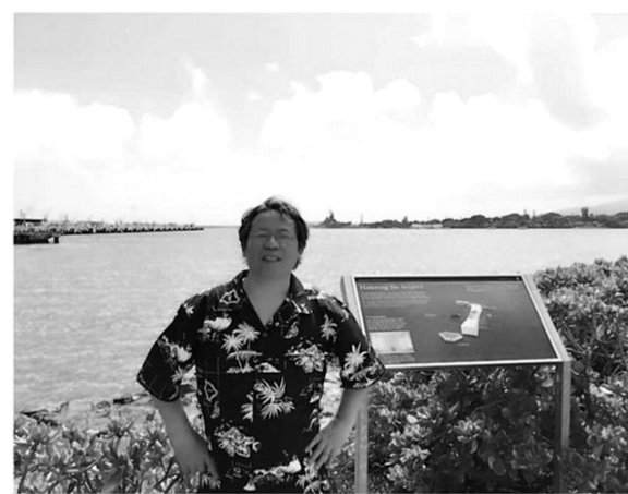
▲作者在珍珠港留影。

中部则横跨在战舰的遗骸之上,与沉船构成了一个无形的十字架。中部上方的镂空设计,令我想起饱受创伤的战舰。透过镂空的天顶,仰望的是高高飘扬的美国国旗。你能看到,旗杆是从沉睡海底的战舰主桅杆连接而上的。据说,每天清晨,海军士兵依然会为这艘再也不能出航的战舰升起国旗。