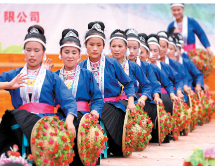
▲群众在表演民俗舞蹈。