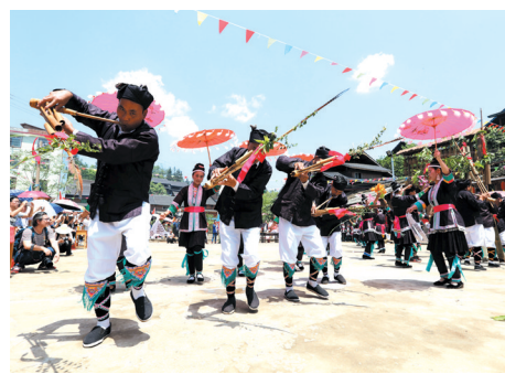
▲三江侗族自治县洋溪乡高露村,群众在表演芦笙踩堂舞。