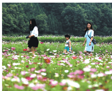
▲游客在三江侗族自治县丹洲镇镇必村格桑花园内赏花拍照。