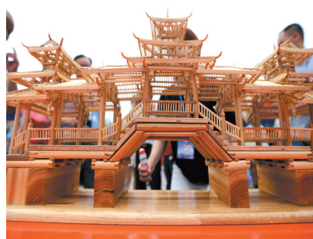
▲群众在观看风雨桥模型。