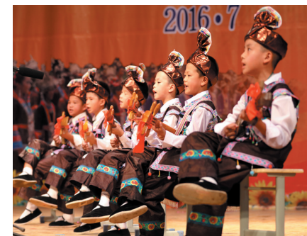
▲小朋友在表演琵琶歌。