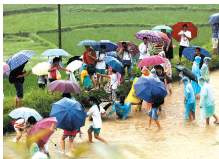
▲游客在三江侗族自治县林溪镇高秀村体验抓鱼的乐趣。