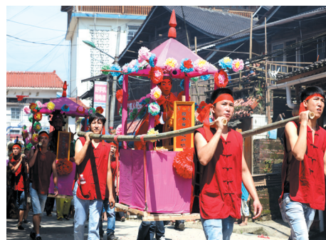
▲群众在三江侗族自治县洋溪乡传统民歌节上进行民俗巡游。