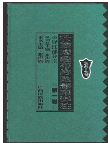
▲壮族麽经布洛陀影印译注2。

解、内容概述、语音说明和原行校订等五个方面的情况。对经文中重要的民俗、宗教术语、语言内涵等则作脚注。