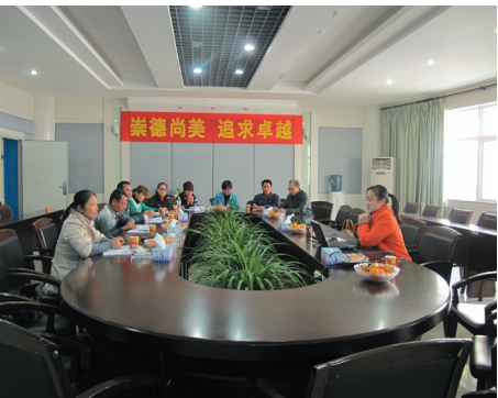
▲学校领导积极参加上级部门举办的教研课改。