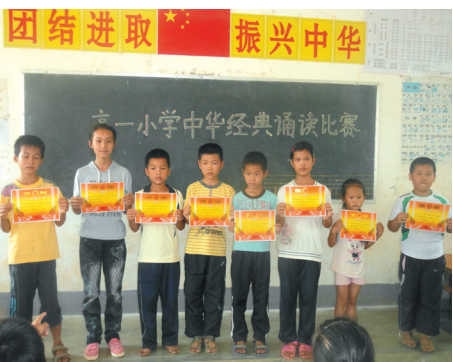
▲学校举办的中华经典诵读比赛获奖的同学。