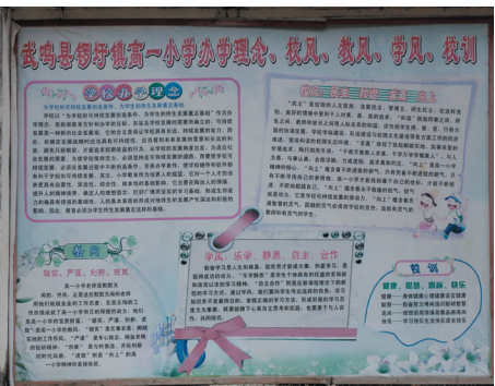
▲学校的“校训”“校风”“学风”“教风”“理念”都贴在学校的宣传栏上。

武鸣县锣圩镇高一民族团结小学坐落在锣圩镇的西北面,距镇政府所在地10公里左右,交通便利。学校创办于1931年,原名为“高利一村国民基础学校”。新中国成立后改为“高一小学”;1981年开展壮汉双语教学实验,是全县四个壮汉双语教学实验学校之一。2003年更名为“高一民族团结小学”。学校创办至今已有85年的历史,现为一所完全由国家拨款办的小学。