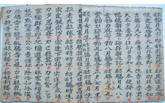
▲《小除服 连满服在尾 功德牒在尾》抄本。

贵古籍名录》,编号11356。 该抄本为壮族道公经书,在壮族道公为守孝满三年的孝子女举行脱孝服法事仪式时唱诵。在壮族民间,孝子女为亡母守孝满三年要请道公前来举行脱孝服法事仪式,唱养育歌,叙述亡母十月怀胎、抚育儿女成人的艰辛过程,寄托家人对先母的无限哀思。 《小除服 连满服在尾 功德牒在尾》的书名为汉文。意为举行脱孝服仪式、含唱脱孝歌和功德牒文在后的