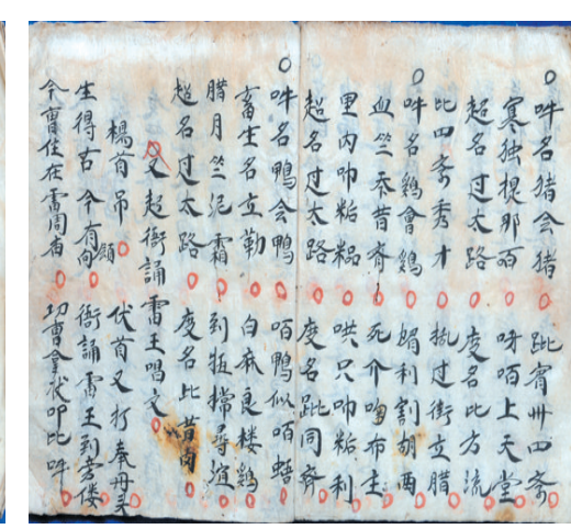
▲《大熟筵点筵会》抄本。

录》,编号09842。 该书为壮族师公经书,主要在壮族民间师公举行献祭牲品请神法事仪式时使用。壮族师公在举行不同的法事时所用牲品有所不同,大多数法事既有荤食又有素食,如鸡、鸭、猪肉、米饭、水果等,这些荤食都是煮熟的,故这种法事所设的祭台称为“熟筵”;如遇到祝寿和幼儿夭折等特殊法事,所供祭品均为素食,称为“生筵”。 《大熟筵点筵会》意为献祭牲品