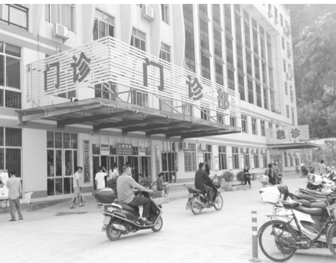
▲都安人民医院门诊部。

生医疗惠民工程深入实施。全县卫生事业经历了一个从无到有、从弱到强、逐步走向蓬勃发展的过程,为人民筑起了一道道坚实的健康屏障。