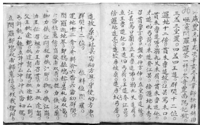
▲《秘法总怪字 禁官符全本火家烧狼》抄本。