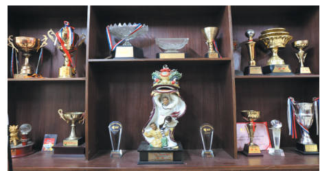
▲藤县舞狮队获得的奖杯。