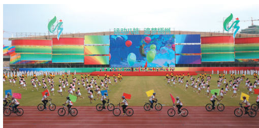
▲开幕式上演出《奔跑的时代》。