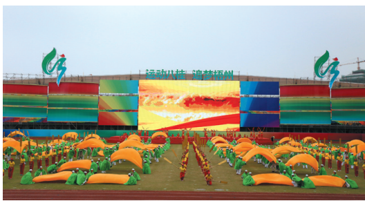
▲开幕式上演出《金色梦想》。