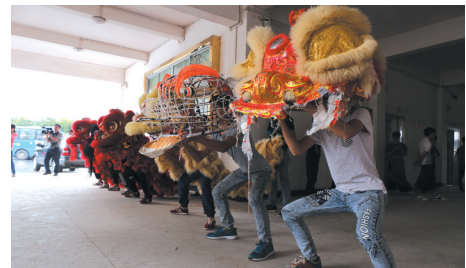
▲舞狮专项班的学生正在训练。