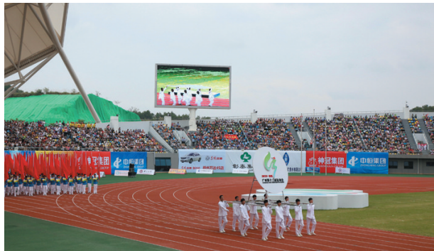
▲第十三届区运会会徽。

据悉,截至开幕式前,青少年组部分赛事已开赛,其余青少年组比赛和成年组比赛也将有序展开,本届运动将于11月18日在梧州市举行闭幕式。来自全区14个市和15个各行业的29个代表团共6326名运动员、教练员、领队参加了本次区运会,他们将在青少年组20个大项和成年组11个大项中角逐715枚金牌。第十二届梧州宝石节、第八届西江经济发展论坛也于11月8日举行。