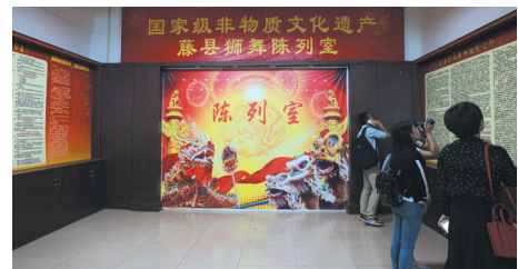
▲自治区民族传统体育保护传承示范基地、藤县舞狮陈列室场景。