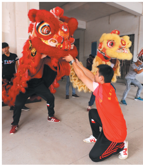
▲舞狮老师正在向学生传授技艺。