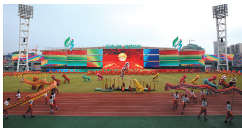
▲开幕式上演出《舞狮雄风》。