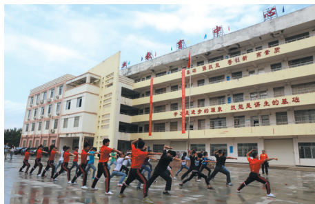
▲班主任正带着学生们进行日常操练。