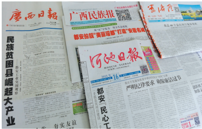
▲各级媒体宣传报道都安60年来取得的成就。

除了上网阅读报刊外,我还在公众微信平台看到,目前家乡迎接县庆的宣传活动,一波连着一波,家乡变得真美呵!”近日,在北京工作的蒙玉彩回短信告诉生活在都安的友人。随着都安瑶族自治县成立60周年喜庆日子脚步声越来越近,四面八方受众从宣传报道中领略党的民族政策给70多万都安瑶族同胞带来的福音,社会各界人士无不点赞有加。