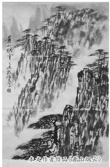
本文作者作品《黄山烟云》

再回首,只有痛。今年10月19日,我在《广西民族报》上读到我大哥的一篇文章《您看青山多妩媚》,我大哭一场。心伤之余,我将此文在朋友圈中转发。父亲走了,他带着对家人对子女博大深沉的爱匆匆地走了。这些天,我的心情一直不能平静,眼前时常浮现他老人家的面容,父亲从青山中走来,又回到青山中去了。很多朋友给我发来微信,劝我节哀,化悲苦为动力,面对生活,笑看人生,愿老人家一路走好!老人家有青山做伴,他不会寂寞。