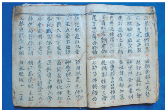
▲《土话全集壹卷》影印件。

过去学术界认为,毛南族只有自己的语言没有自己的文字。《土话全集壹卷》经文全部为毛南族土俗字抄写,且文字造字方式多样,记录音、义相对准确,自成体系,突破了毛南族“有言无文”的传统观念。该抄本抄写年代确切,在南方民间宗教经书中版本较早,对研究毛南族历史、文化、信仰、习俗、语言、文字等均有重要参考价值。该抄本由广西壮族自治区少数