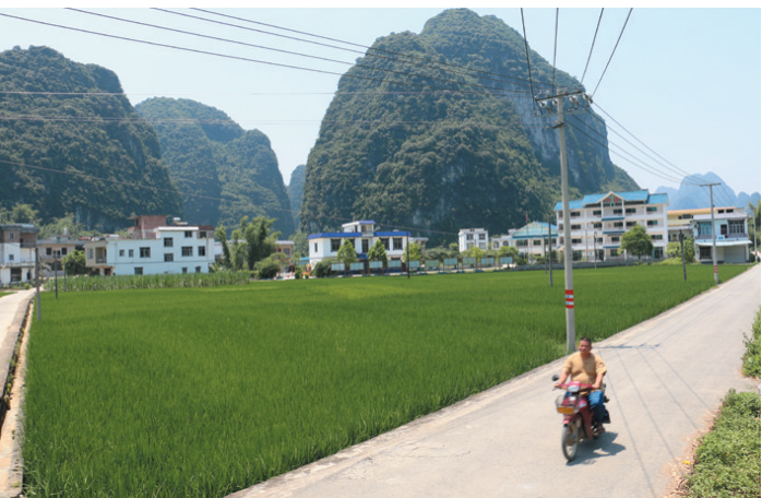
▲地苏镇大定村美丽生态乡村新貌一角。