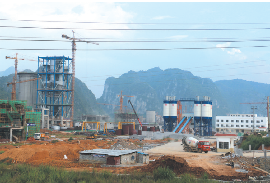
▲临港工业蓬勃发展。

今年6月份以来,河池·都安临港工业区红渡作业区码头开通运行、三岛湾国际度假区开门营业等60周年县庆项目陆续竣工并投入使用。与此同时,建设隆福至崇山全长10公里、宽4.5米的通村水泥公路已经铺完,被列为精准扶贫的崇山、大崇等村1200多贫困人口行路难问题终于彻底解决。今年以来,都安瑶族自治县党委、政府一手抓县庆项目建设,一手抓精准扶贫攻坚,实现了县庆项目建设与精准扶贫的“民心工程”齐头并进的良好势头。