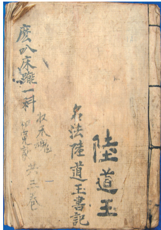
▲《麽叭床能一科》抄本。