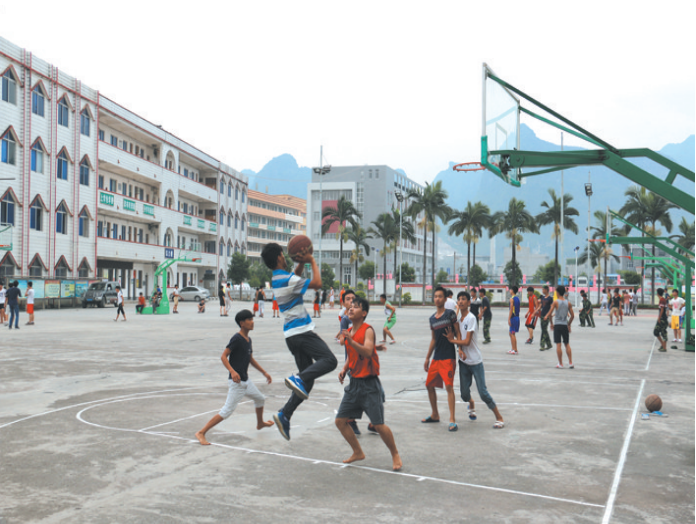
▲都安职业教育中心学校的学生进行课外活动的场景。

民族职教展新姿，满园春色映瑶山。都安瑶族自治县职教中心学校成立于2008年，以创办于1983年的都安县职业中专学校为主校园，是都安唯一一所集中职全日制教育、职业技能培训、成人职业技能教育为一体的公办中职学校。学校于1996年被自治区教育厅认定为“自治区示范职业高中”，2010年被自治区教育厅、财政厅认定为“自治区示范中等职业学校”，2011年获得广西职业教育攻坚先进集体；