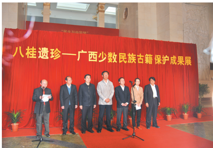
▲八桂遗珍——广西少数民族古籍保护成果展于2014年3月24日在北京民族文化宫开展。

在整理民族古籍工作中,广西始终坚持民族性、科学性、规范性的“三性”原则,采用“五行对照”制的翻译整理方法。“五行对照”制实际上就是用五种形式来译注古籍的体例,即第一行为古籍原文,第二行为古籍原文的国际音标行,第三行为古籍原文的民族拼音文字行,第四行为古籍原文的汉字译行,第五行为古籍原文的汉字译行。在“五行对照”制中,第一、