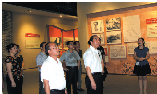
▲活动人员参观韦拔群纪念馆。