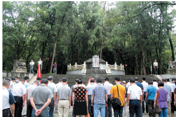
▲活动人员瞻仰韦拔群烈士墓。