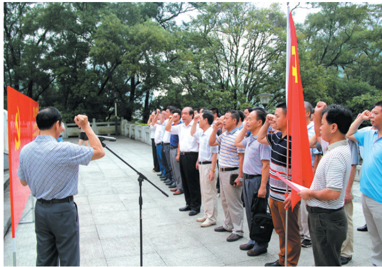
▲活动人员在革命烈士纪念馆前重温入党誓词。