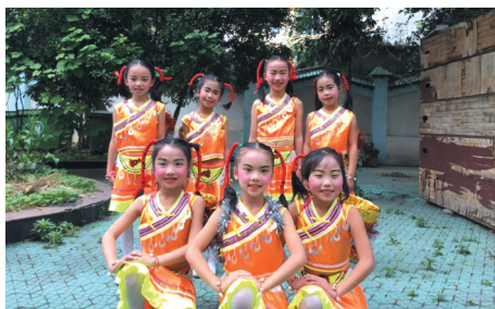
▲学生参与第四届文化艺术节展演。