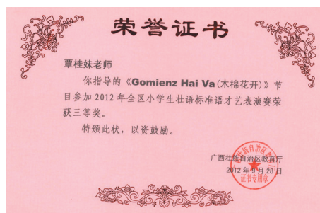
▲学校教师指导学生参加壮语才艺表演荣获三等奖。

宜州市祥贝乡中心小学坐落于群山之中, 创始于1934年, 2003年更名为现今的祥贝乡中心小学, 是一所历经81年沧桑的老校。2011年8月, 全乡进行学校布局调整, 学校搬迁至原来的祥贝中学。如今的祥贝乡中心小学占地面积有19576.69平方米, 建筑占地面积有2508.26平方米, 是这群山美景之乡中唯一的一所寄宿制小学, 也是全乡中小学教育的中心。