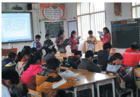
▲新课改下的课堂展现出勃勃生机。

着眼未来, 培养志向远大、素质全面协调发展, 有理想、有道德、有文化、有纪律, 同时又能让民族文化传承的学生, 是学校的根本, 是学校教育教学所努力的方向。