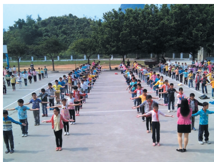
▲大课间活动中全校学生共同展示“感恩的心”。