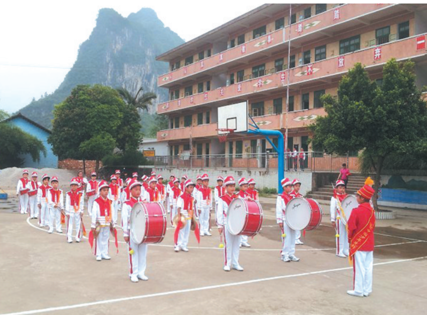
▲学生参加2014年鼓号队大检阅前的准备。