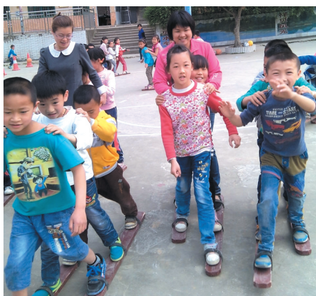
▲师生共同参与三人板鞋竞速活动。