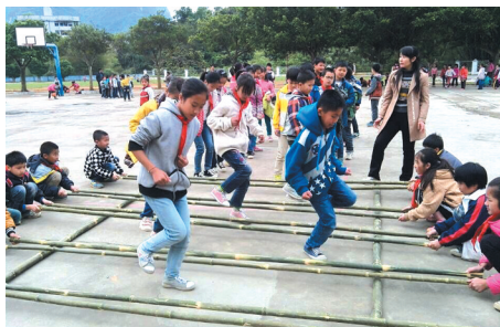
▲丰富多彩的大课间活动——竹竿舞。