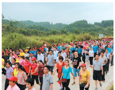
▲“霞客行”健康徒步登山游队伍在出发。

节日成发展盛会。 几年来,借助“5.19”旅游这个平台,上林县成功签约了“三湖一寨”等重大项目20多个,总投资超过100亿元。由于企业和全县上下的共同努力,这些项目得到加快推进。龙母湖项目于今年4月2日开工,云里湖大坝竣工蓄水,金莲湖金珂书画院、和平祈福坛项目正在加快装修,鼓鸣寨于今年5月1日开园。今年的“5.19”,该县又签约上林生态旅游养生度假酒店、壮族老家骆越文化古镇等6个项目,总投资达18亿元。“5.19”已经成为企业家们了解上林的重要平台,是洽谈签约项目、实现共同发展的盛会。据介绍,上林将继续转变作风、提效能,打造开放包容、廉洁高效的政务环境,为客商提供“保姆式”服务,让客商进得来、留得住、有钱赚。