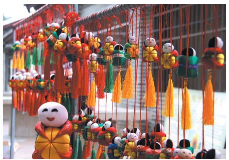
▲展销会上的民族装饰品。