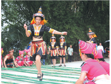
▲跳起竹竿舞,欢迎远方宾客。