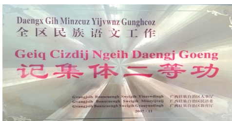
▲ 新龙小学获得的荣誉。