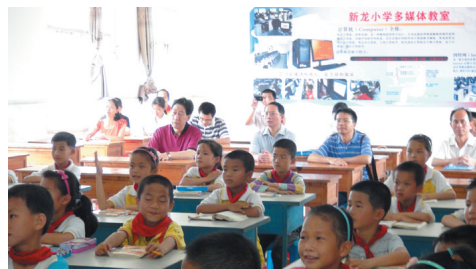
▲ 国家教育部调研组深入新龙小学课堂听课。