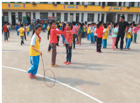
▲ 大课间学生练习滚铁环。