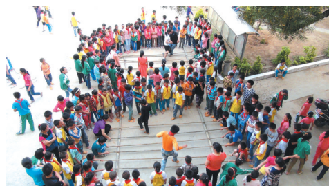
▲ 大课间丰富多彩的民族文化活动——竹竿舞。

开展壮汉双语教育30多年来, 新龙小学领导班子认真贯彻党的教育方针, 高度重视民族教育, 全面实施素质教育, 全力创建和谐校园, 教育教学工作取得丰硕成果。近10年来, 全校教师荣获市(地)级各类荣誉称号11人次, 县级各类荣誉称号20多人, 全校学生参加县级以上各类竞赛评比获奖达147人次, 学校先后获得“全区民族语文工作先进集体二等功”、“广西教育工会先进教职工小家”、“武宣县民族语文工作先进集体”等荣誉称号。