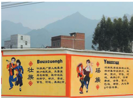
▲ 学校的民族文化墙。