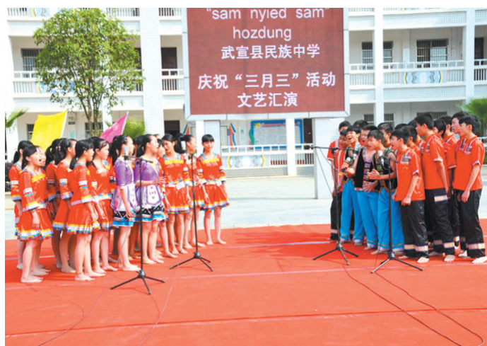
▲ 小歌手们正在进行山歌对唱。

在今年“壮族三月三”节日活动中,最有特色的当属民族特色美食一条街。在这条“街”,前来参加活动的领导、贵宾和全校师生一起共同品尝了武宣本地特色小吃:五色糯米饭、竹筒饭、红糟酸、雷公根酸、艾粑粑、蕉叶粑粑、豆腐菜包、豆腐包、粽子等。面对品种繁多的特色小吃,“食客”们由衷地发出一声又一声的赞叹。