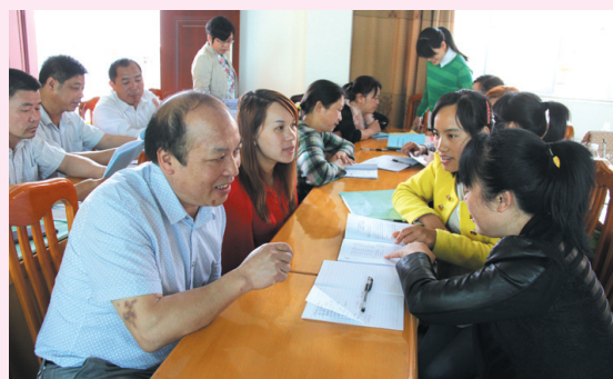
▲ 分组讨论,大家踊跃发言。