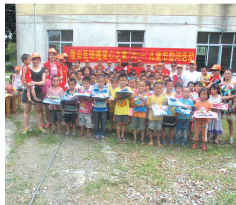
▲爱心人士到学校看望留守儿童。

不但是老师参加活动,学生们也积极参加各种壮汉双语活动。2012年,该校学生在参加县里举办的小学生标准壮语才艺表演比赛中取得一等奖,并代表全县到南宁参加全区小学生标准壮语才艺表演。同时,同学们还积极参与与每年全区举办的学生标准壮语故事比赛。孩子们通过外出参加各种活动,增长了知识,开阔了眼界,各方面的能力也得到了锻炼和提高。壮汉双语教育的教学模式也因此得到了家长和村民的赞许和支持。