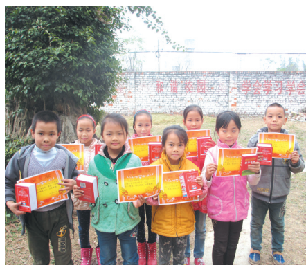
▲学生们参加镇里举办的教学及听写比赛取得好成绩。