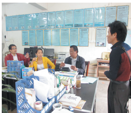
▲县教育局领导到学校指导教学工作。