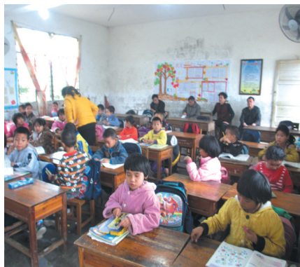
▲县教育局领导到学校听课。