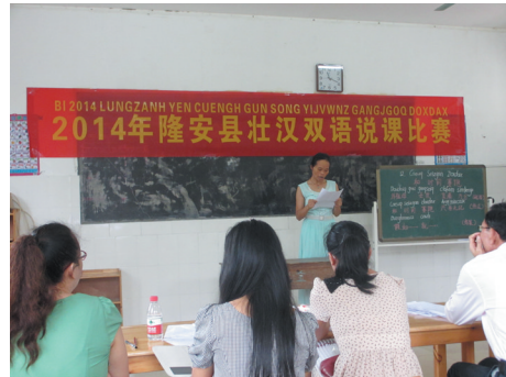
▲学校老师参加全区壮汉双语讲课比赛。

双语教育使荣和光彩学校取得了实实在在的教学成果,也得到了教育主管部门及群众的认可。相信有各级领导的支持,有学校师生的努力,学校的明天会越来越好。