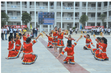
▲学生表演优美的民族舞蹈。