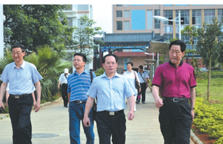
▲2014年5月14日,教育部、国家民族联合调研组在自治区民族教育发展中心及县领导陪同下到武宣县民族中学调研。