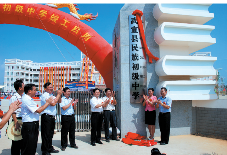
▲2012年9月10日,学校举行揭牌典礼。