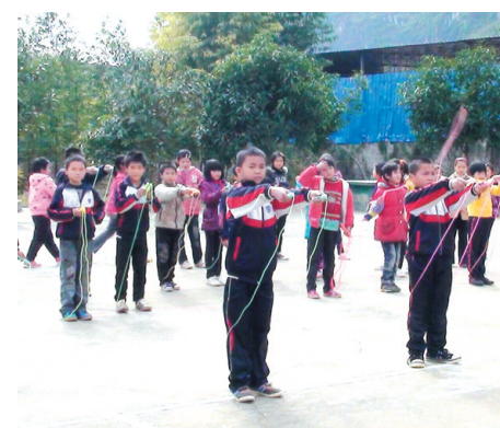
▲学校经常组织学生开展体育活动。图为学生参加跳绳比赛。