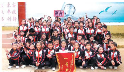
▲学校体操队在比赛活动中取得优异成绩。