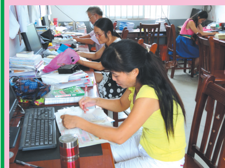
▲老师们认真批改作业。