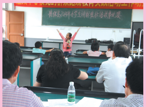
▲学生参加全区标准壮语讲故事比赛选拔赛。