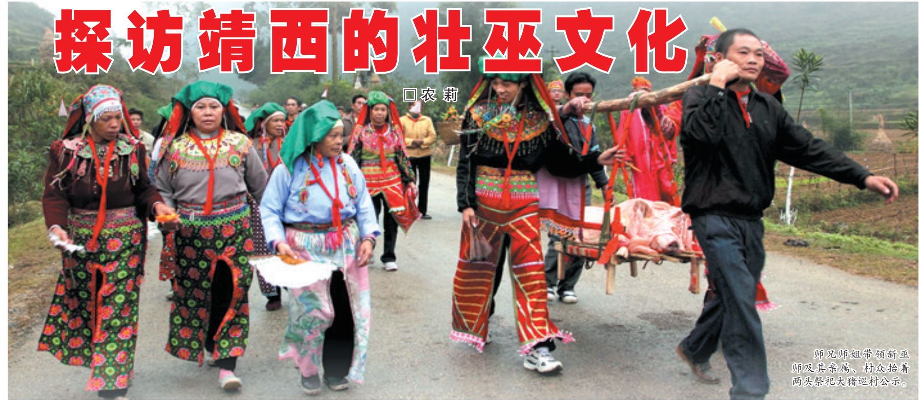
师兄师姐带领新巫师及其亲属、村众抬着两头祭祀大猪巡村公示。

壮巫是壮族特定历史的产物。生活在生产力十分低下的壮族原始初民，他们对自然界各种现象的无穷变化之奥秘无法解释，于是他们便幻想着去寻找一种超然的神力，希望通过它来消灾除祸，驱瘟防病，排除饥饿，并让动物、庄稼、寿考等遵从自己的意旨，使自己在心灵上得到安慰，精神上得以寄托。壮巫是在原始社会里人们的自然意识下产生的。