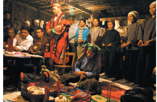
▲新巫师的众位亲属每人拿一条香枝，围在师兄、师姐周围配合祭告。