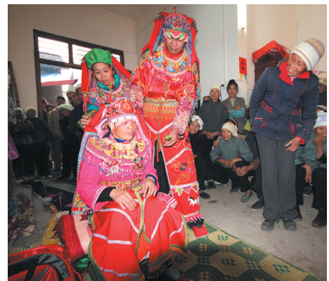
▲师兄及师姐代表“祖师”为新巫师戴上“巫”的行头。