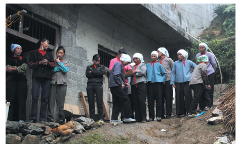
▲加冕时邀请邻村的妇女来做后勤。