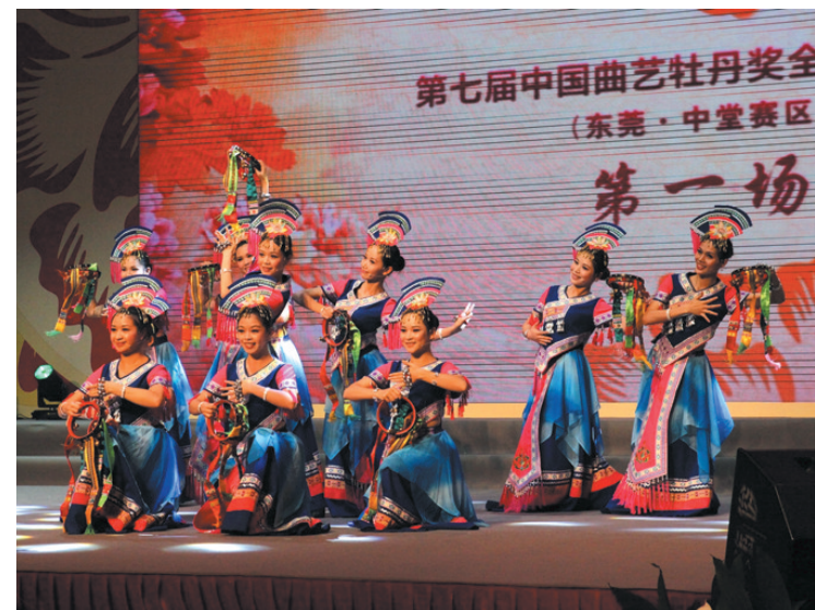
▲壮族未伦《报哭的春天》获第七届中国曲艺牡丹奖全国曲艺大赛(东莞赛区)文学提名奖。