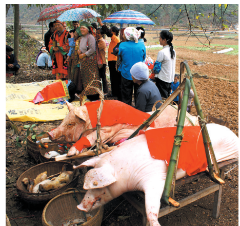
▲新巫师到村头的土地庙扣拜土地神。