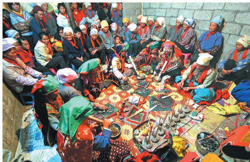
▲师兄、师姐们设坛祭师为新巫师“通关”的场面。

尽管靖西巫教是一部带有迷信色彩的壮巫典籍，然而当我们去掉其神秘的色彩，用历史唯物主义的观点来观照，就会发现，巫术在艺术上不愧是壮族文化艺术宝库中的精品，是原生形态的壮族未伦艺术。壮族未伦起源于巫文化，有悠久的发展历史、深厚的文化底蕴以及独特的艺术魅力，故而具有文学、音乐、美学等方面的审美价值和研究价值。2012年靖西壮族未伦入选自治区级非物质文化遗产保护名录。