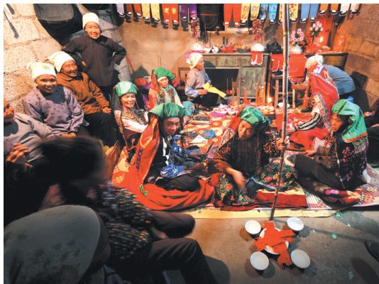
▲甘蔗祈福新巫师以后生活如蜜甜。