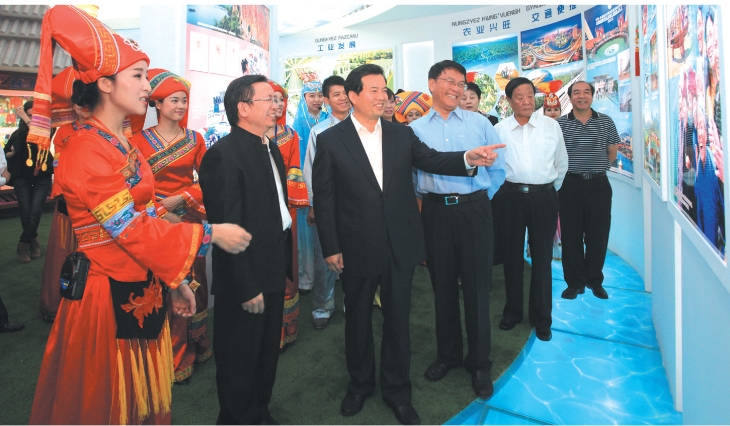
▲全国政协副主席、国家民委主任王正伟(前左三)在主办单位相关负责人及广西区民委党组书记、主任卢献匾(前左二)陪同下参观广西特展区。