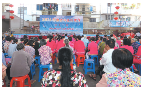
▲山歌会现场人山人海。