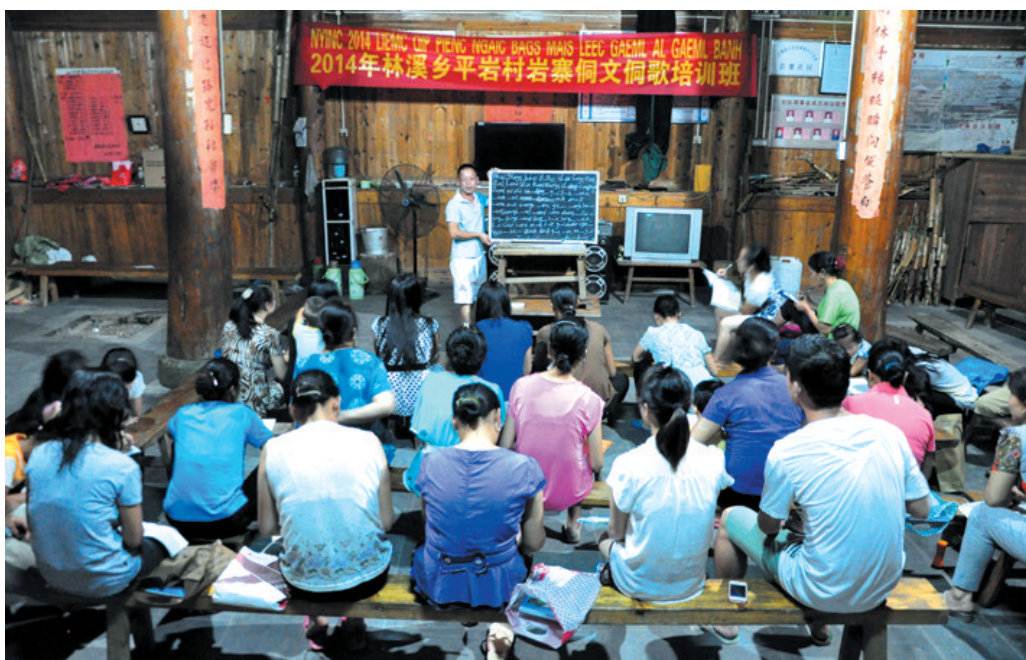
▲三江侗族自治县林溪乡平岩村岩寨侗文侗歌培训班授课现场。