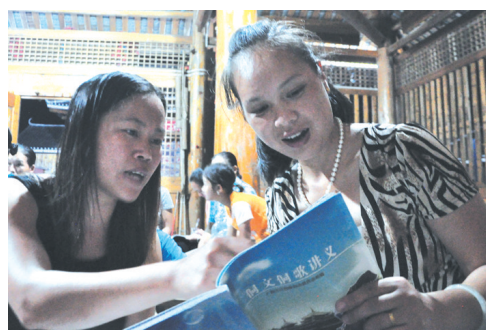
▲学生在认真地学习侗文。