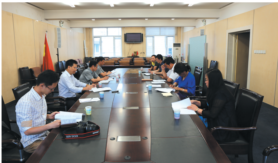
▲自治区民语委调研组成员与内蒙古自治区民宗委领导、专家进行交流。

坚持发挥“三个委员会”作用,促进蒙古语文工作全面协调发展。一是以蒙古语名词术语的规范统一为主要任务,以自治区蒙古语名词术语委员会和蒙古文正词法委员会为依托,组织开展蒙古语新名词术语和专业名词术语的审定工作,定期发布具有权威性、及时性和实用性的蒙古语名词术语公报。二是以促进蒙古语标准音的推广普及为主要任务,以内蒙古自治区蒙古语标准音工作委员会及全区15个蒙古语标准音培训测试站为依托,组织开展蒙古语标准音培训和测试,稳步推进蒙古语标准音的推广普及。三是贯彻落实《内蒙古自治区人民政府关于加快推进蒙古语言文字信息化建设的意见》为主要任务,认真组织实施蒙古语言文字信息化专项扶持项目,大力促进蒙古语言文字信息化基础研究、技术研发、资源建设、推广应用等各个领域的协调发展。