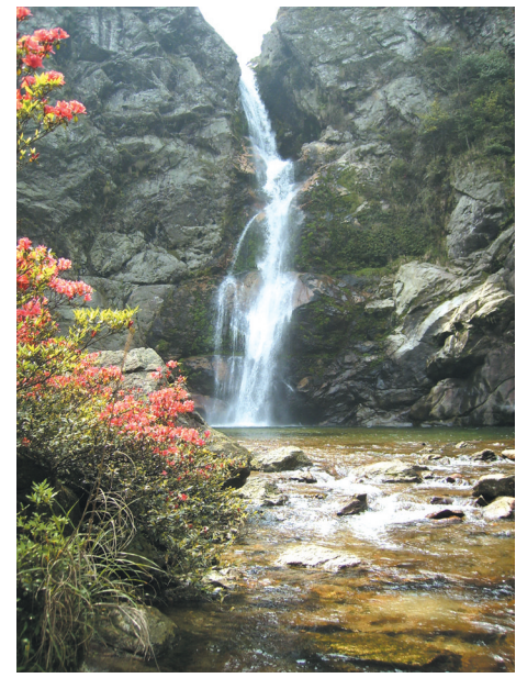
▲平龙冲瀑布。