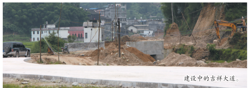
建设中的吉祥大道。