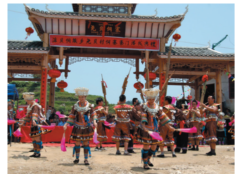
▲滚贝侗族乡第一座侗族寨门——尧贝村寨门竣工。