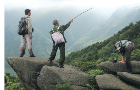
▲滚贝风光——庆林山一角。