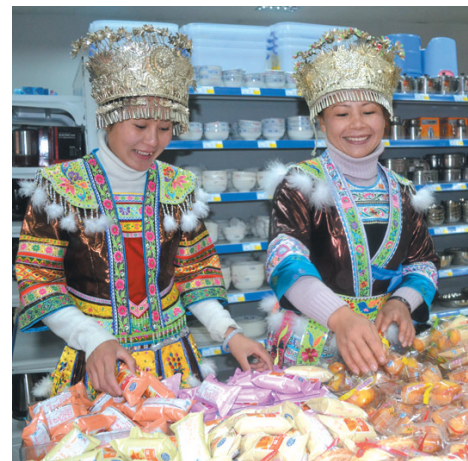
▲2013年12月16日,滚贝乡超市开业当天,侗族姑娘在选购商品。