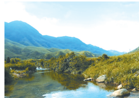
▲滚贝风光——平龙夏景。