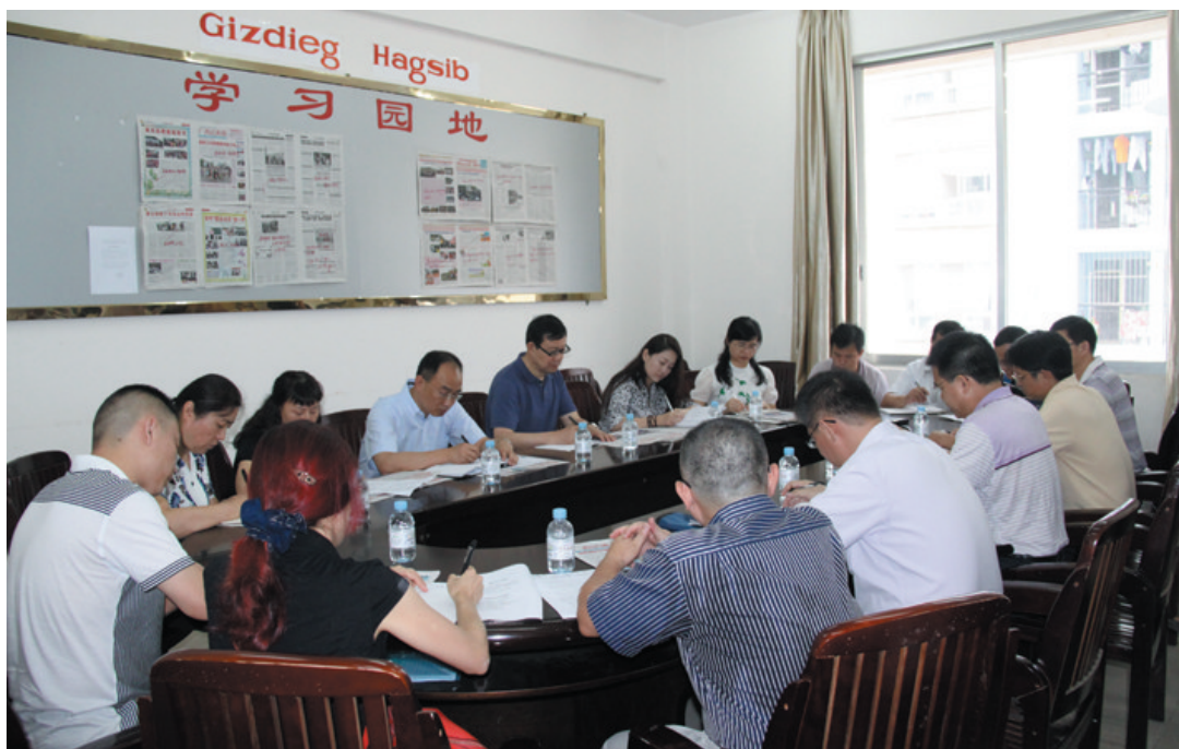
▲云南少数民族语文出版调研组与本报人员进行交流座谈。

石卫在会上就民族文字报刊在信息化的今天如何独辟蹊径充分发挥传承民族文化的作用作了发言。梁晓松就当前新闻出版广电部门对我区民族文字报刊扶持情况做了说明。本报全体员工参加此次座谈会。