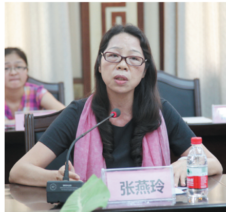
▲著名评论家、《南方文坛》主编张燕玲在发言。