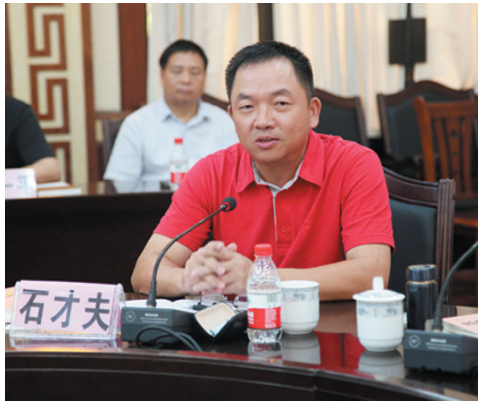
▲广西区文联副主席石才夫在研讨会上发言。