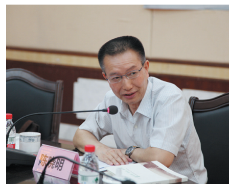
▲北京大学教授、著名评论家陈晓明在发言。