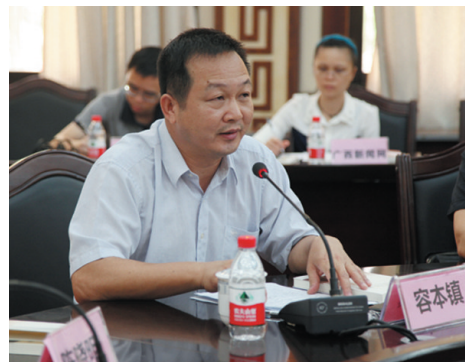
▲广西教育学院院长容本镇发言。